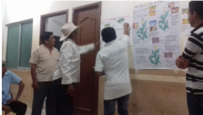
Figura 2.-Exposición en maya sobre pulgón amarillo en maíz.