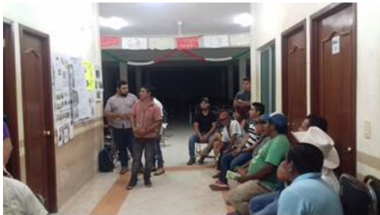
Figura 3.-Exposición sobre “ Phytophthora ” en Piña.