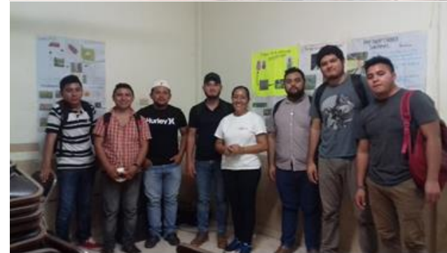
Figura 6. Grupo que promovió la actividad.