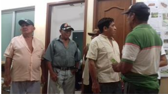
Figura 5.-Intercambio de experiencias entre asistentes.