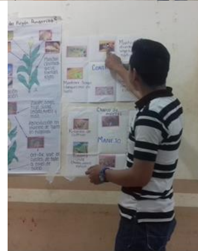
Figura 4.-Exposición sobre gusano cogollero en maíz.